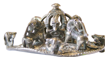
Fig. 2. Runt silverspänne av barock typ från Väsby i Skå /Uppland.

Kontakt: michaelneiss@hotmail.com Hemsida: http://michaelneiss.hardell.net